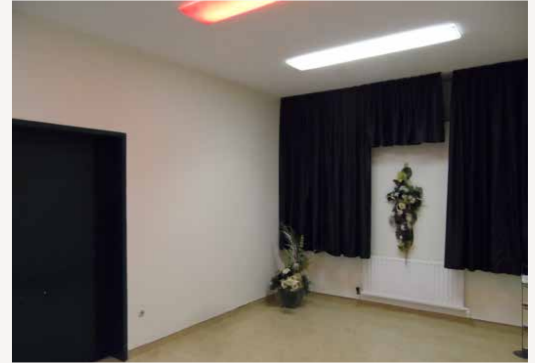
Ausgangspunkt – Aufbahrungsraum Helios Klinikum - bis Sommer 2016